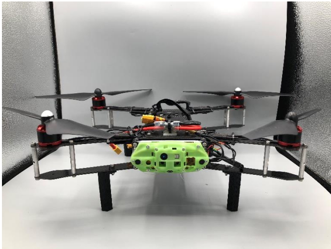
(Modal AI 社製 AI カメラ搭載 自動室内航行用ドローン (標準機))